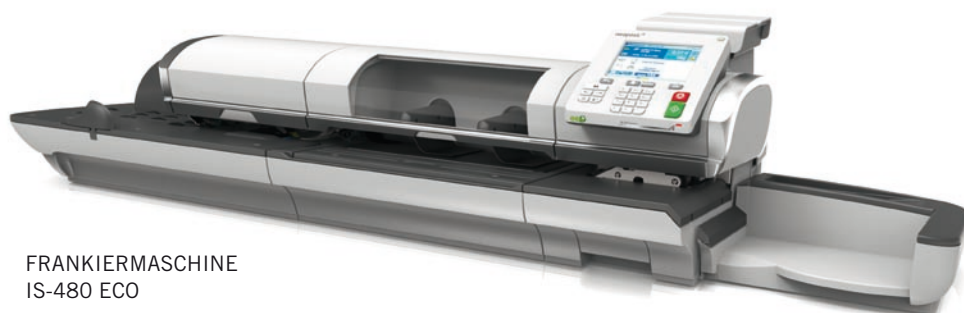
FRANKIERMASCHINE IS-480 ECO

Einen spannenden Querschnitt durch das Neopost-Portfolio gibt es vom 8. bis 11. Oktober 2014 auf der Druck+Form in Sinsheim: Neben OMS-500 ist auch modernste Software für Farb- und Kuvertiermanagement sowie E-Invoicing dabei. Außerdem werden die neuesten Maschinen zum Drucken, Kuvertieren, Adressieren und Frankieren vorgestellt. Alles live zu sehen bei Neopost, Halle 6, Stand 6402. ■