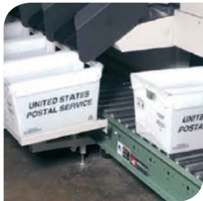
Optional: Förderer für gefüllte Behälter