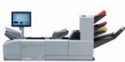
3 DOKUMENTEN-ZUFÜHRSTATIONEN 1 BEILAGENSCHACHT + SAMMELBEREICH + AUSSTEUERFACH