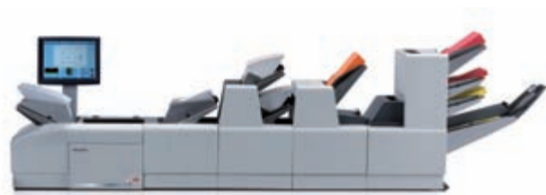
4 DOKUMENTEN-ZUFÜHRSTATIONEN 3 BEILAGENSCHÄCHTE + SAMMELBEREICH + AUSSTEUERFACH