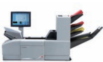
3 DOK.-ZUFÜHRSTATIONEN + SAMMELBEREICH

Durch den modularen Aufbau der DS-140 brauchen Sie sich bei der Anschaffung nicht den Kopf darüber zu zerbrechen, welche Anforderungen das System langfristig zu erfüllen hat. Erwerben Sie zur gegebenen Zeit einfach den richtigen Systembaustein hinzu – passend zum Wachstum Ihres Unternehmens. Diverse optionale Funktionen erschließen Ihnen größere Auftragsvolumen und steigern die Produktivität. Durch den modularen Aufbau des Systems ist die Kosteneffizienz Ihrer Anlageinvestition heute genau so wie in Zukunft gewährleistet.